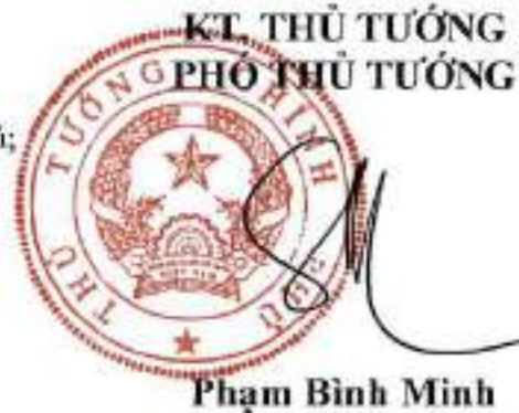
Phạm Bình Minh